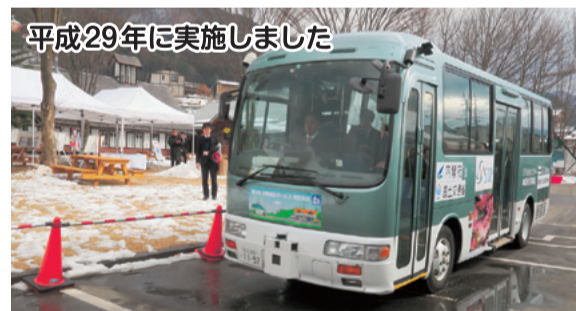
平成29年に実施しました

い〜なちゃんカード(伊那コミュニティーカード協同組合)の利用促進のサポートをしました