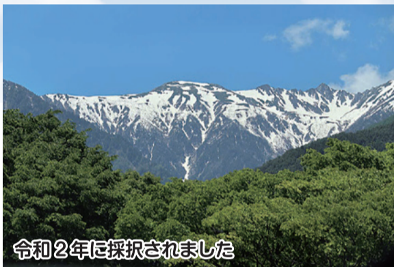
令和2年に採択されました