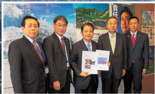
伊駒アルプスロード整備促進のご要望