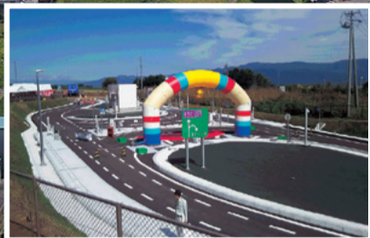
小黒川スマートインター開通