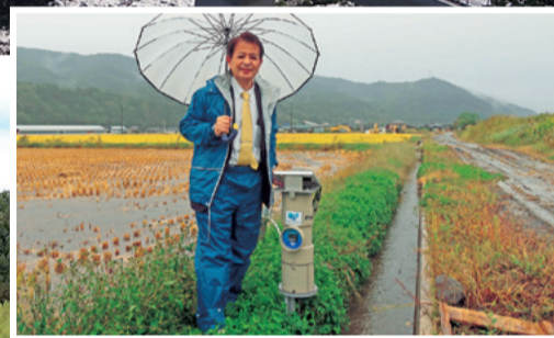
東春近田原の自動給水栓