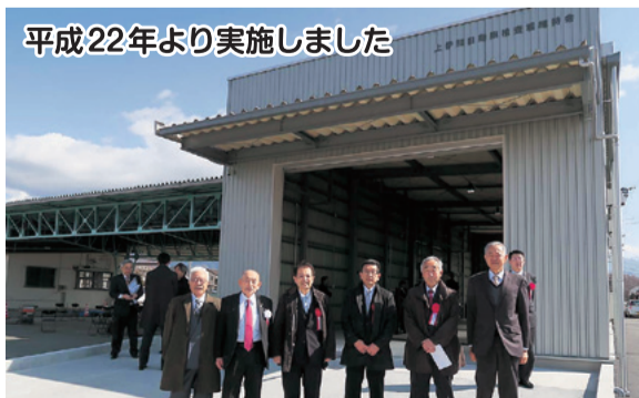
平成22年より実施しました