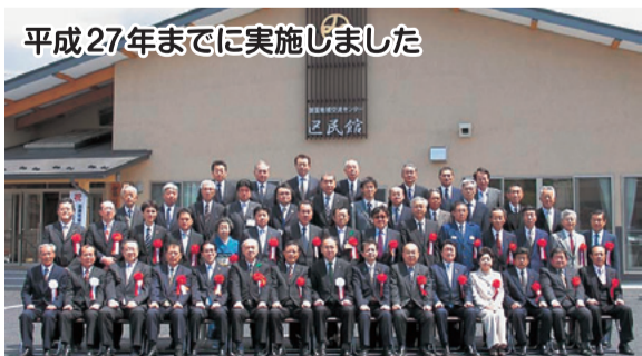
平成27年までに実施しました