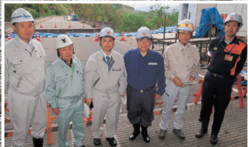
権兵衛峠道路崩落現場の視察