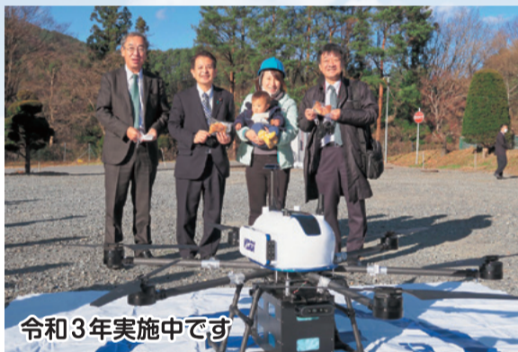
令和3年実施中です