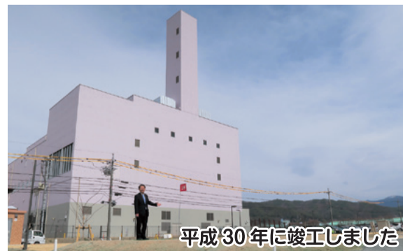
平成30年に竣工しました