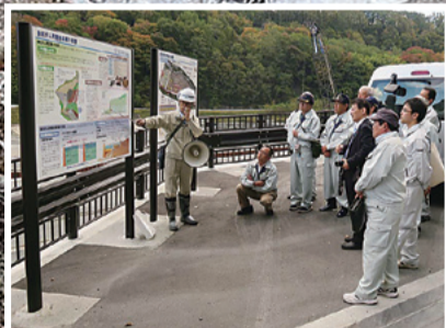
美和ダム再開発視察