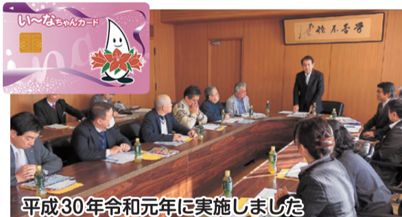
平成30年令和元年に実施しました