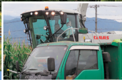
ますみヶ丘の酪農をサポート