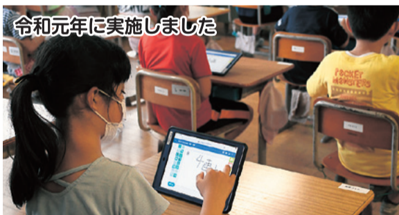
令和元年に実施しました

ドローンを使った物流宅配、モバイルクリニック、ぐるっとタクシー他の実験も行っています