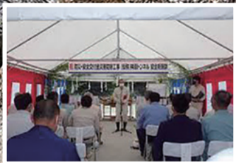
神原トンネル安全祈願