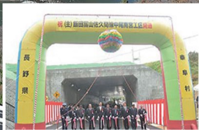
県道1号飯田富山佐久間線