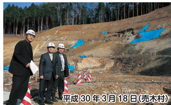
平成30年3月18日(売木村)