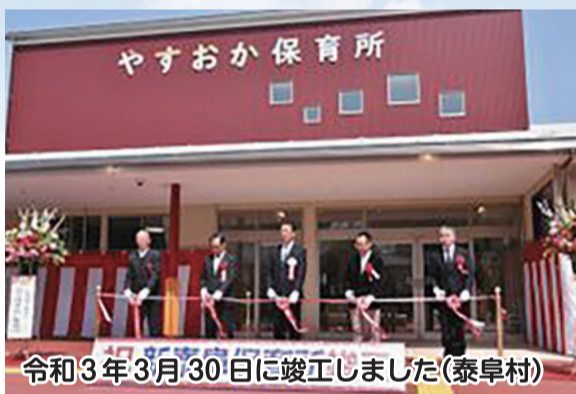
令和3年3月30日に竣工しました(泰阜村)