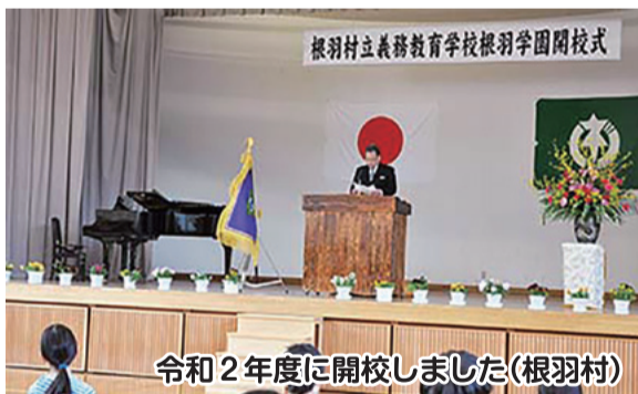
令和2年度に開校しました(根羽村)

地域資源を生かした「阿智村BASE」は多くの方に阿智村を楽しんでいただく施設です