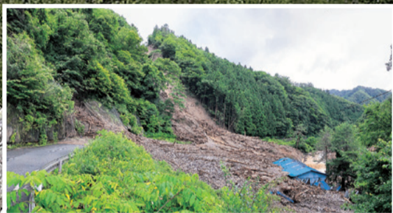
令和2年度7月豪雨災害被災地復旧事業