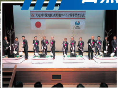
天竜川中流地区直轄地すべり対策事業