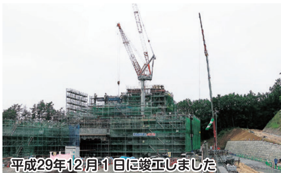
平成29年12月1日に竣工しました