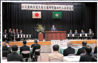
天竜公園阿智線 栗谷トンネル開通