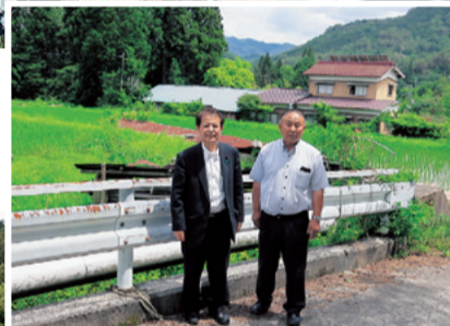
棚田地域振興法に基づく棚田指定