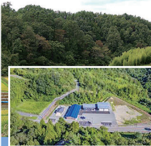
信州「アトム」拠点整備

災害防止・国土保全機能強化など、森林整備を促進するための安定財源を確保します。平成31年に創設しました。