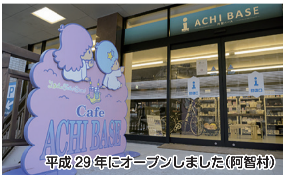
平成29年にオープンしました(阿智村)