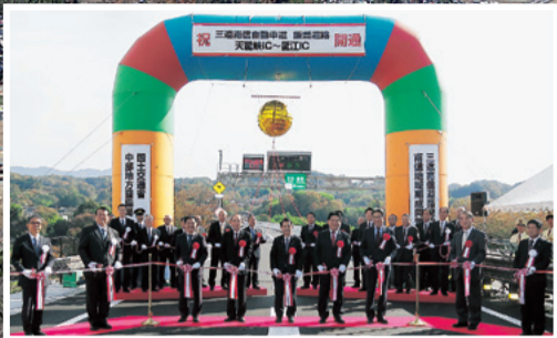
三遠南信自動車道 天龍峡IC~龍江IC開通