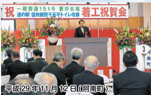
平成29年11月12日(阿南町)