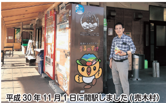
平成30年11月1日に開駅しました(売木村)