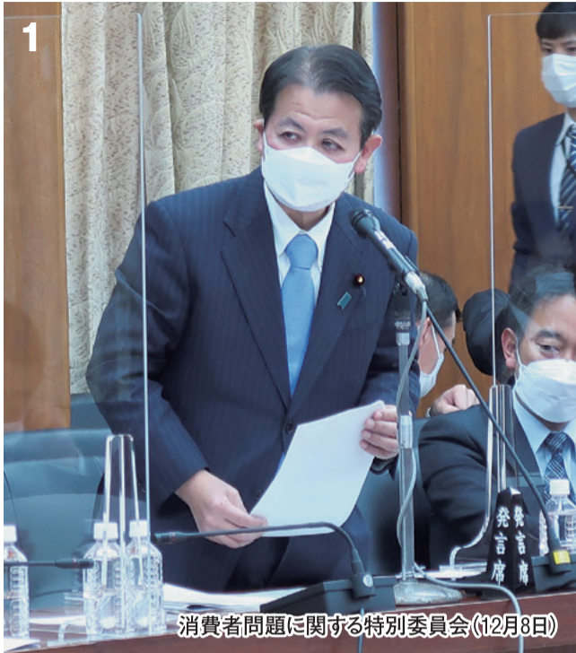
消費者問題に関する特別委員会(12月8日)