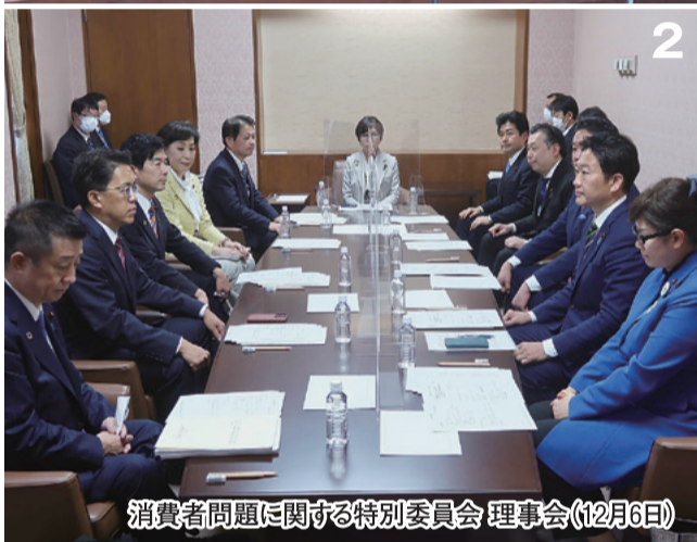
消費者問題に関する特別委員会 理事会(12月6日)