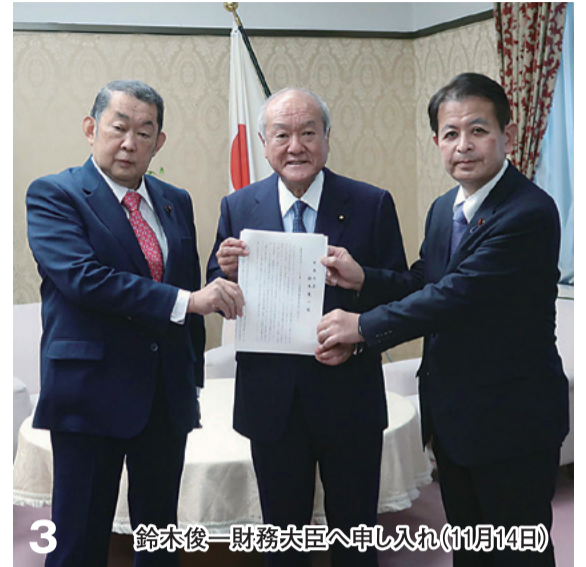
3 鈴木俊一財務大臣へ申し入れ(11月14日)

岸田政権が掲げる新しい資本主義の実現に向けた最重要課題である資産所得倍増プランの具体策としてNISAやiDeCoの抜本的拡充に向けた取り組みの提言を行い税制改正につなげる等、新しい資本主義の実現に向けて活動しました。