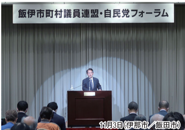
11月3日(伊那市/飯田市)